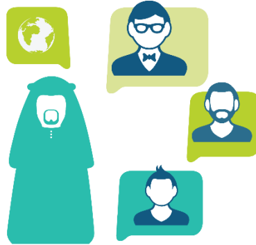
الحوار الحضاري مع الثقافات المختلفة