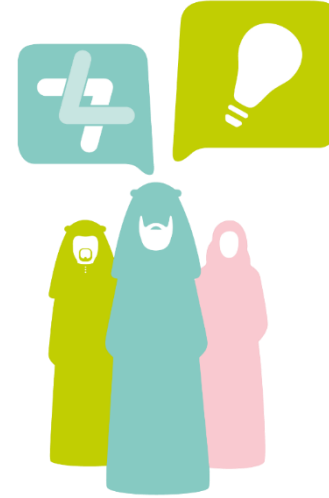
تعزيز الشخصية السعودية وفق رؤية 2030